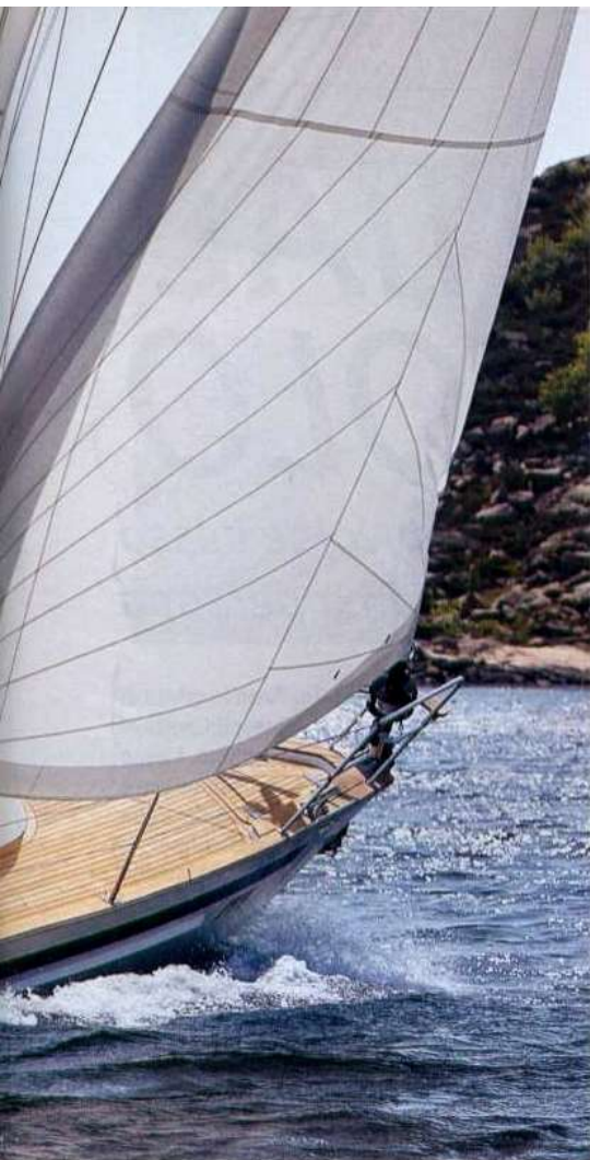
A sinistra, il Malo 37 in navigazione di bolina. Si nota la buona protezione del pozzetto offerta dal parabrezza con capottina integrata. Sotto, la zona carteggio fornita di numerosi stipetti e di una comoda seduta.