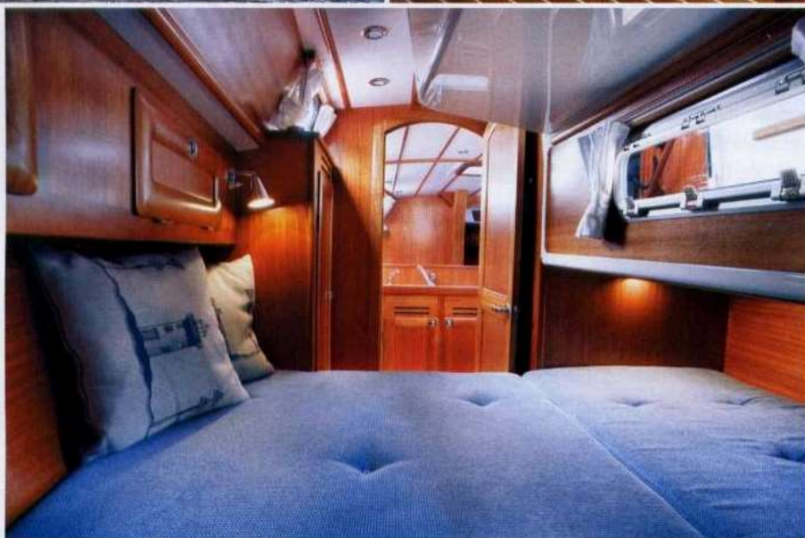
Sopra, la cabina di poppa è dotata di un letto matrimoniale dalle ampie misure. Le finestrature gli conferiscono una buona luminosità nonostante il rivestimento dei legni sia di colore scuro.

to ciò consente sia di avere una zona ospiti ubicata a ridosso dell'ingresso sottocoperta totalmente al di fuori delle manovre sia di poter governare la barca facilmente anche in presenza di un equipaggio ridotto. L'albero in alluminio ha un'altezza di 17 metri ed è fornito di due ordini di crocette aquartierate. L'armo frazionato prevede un piano velico allunga-